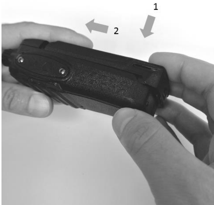
Рис. 2. Установка аккумуляторной батареи.

Совместите направляющие на аккумуляторной батарее с направляющими на шасси приёмопередатчика. Прижмите батарею к шасси и сдвиньте влево до щелчка.