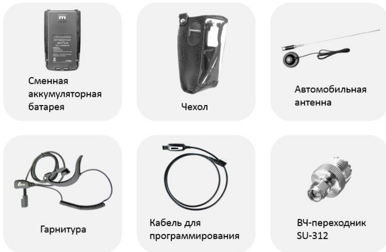
Рис. 10. Рекомендуемые аксессуары.

Рекомендуемые аксессуары Аргут к радиостанции представлены на рисунке 10.