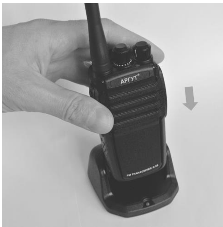
Рис. 6. Установка радиостанции на зарядную базу.

Установите радиостанцию с присоединённым аккумулятором на зарядную базу. Светодиодный индикатор на зарядной базе загорится красным. По окончании зарядки индикатор сменит цвет на зелёный — снимите радиостанцию с зарядной базы.