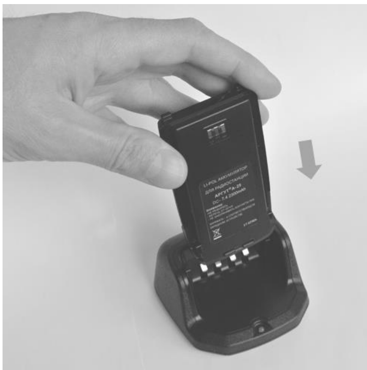
Рис. 7. Установка аккумуляторной батареи на зарядную базу.