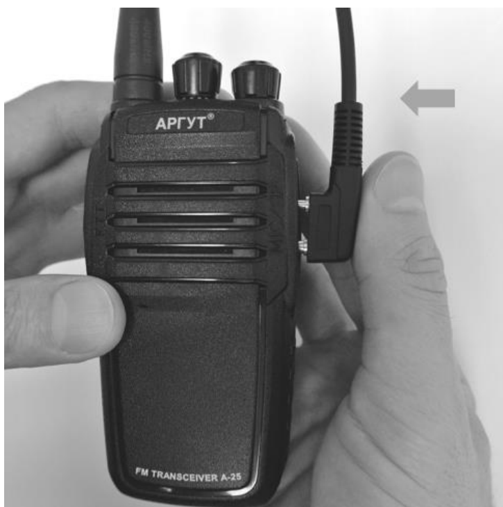
Рис. 9. Подключение гарнитуры.