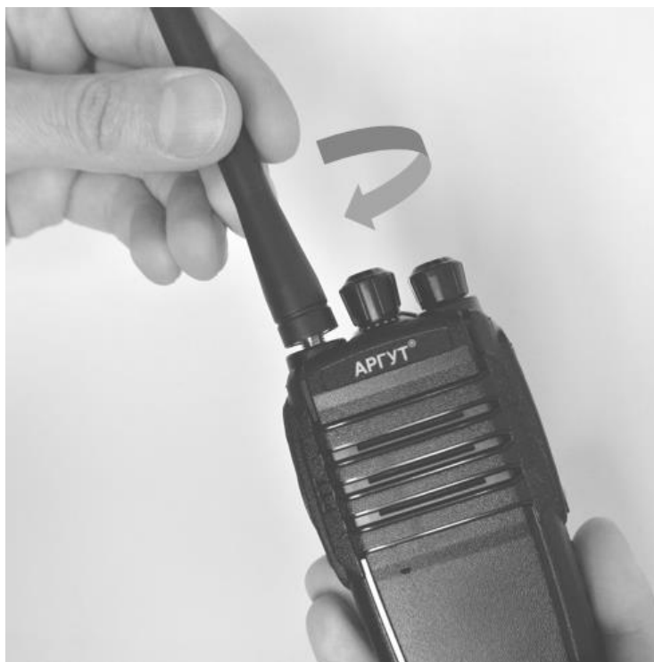
Рис. 4. Присоединение антенны.

Совместите резьбовой соединитель антенны с ВЧ-соединителем на верхней панели радиостанции. Вращая антенну по часовой стрелке закрутите соединитель до упора. Не прилагайте чрезмерных усилий при затяжке.