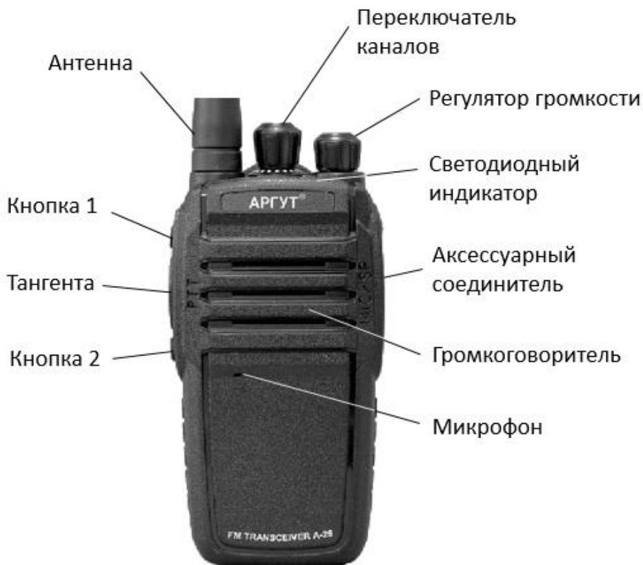
Рис. 1. Расположение органов управления, индикации и соединителей.

Радиостанция выполнена на металлическом шасси, в корпусе из ударопрочного пластика. Органы управления и индикации расположены на верхней и левой панелях корпуса. Соединитель антенны — на верхней панели. Соединитель подключения гарнитуры и кабеля программирования (аксессуарный соединитель) — на правой панели. Клеммы для присоединения к зарядной базе — на задней стенке аккумуляторной батареи.