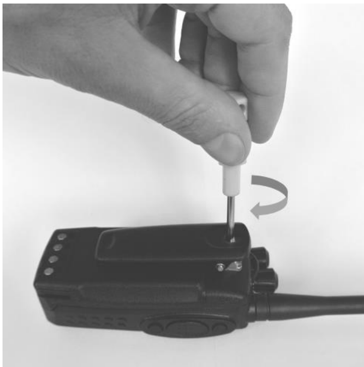
Рис. 5. Присоединение клипсы для крепления.

Если вы планируете носить радиостанцию на поясном ремне или крепить к одежде, присоедините к задней панели клипсу. Совместите крепёжное отверстие клипсы с отверстием на задней панели и закрепите клипсу с помощью винта из комплекта. Используйте крестовую отвёртку №3.