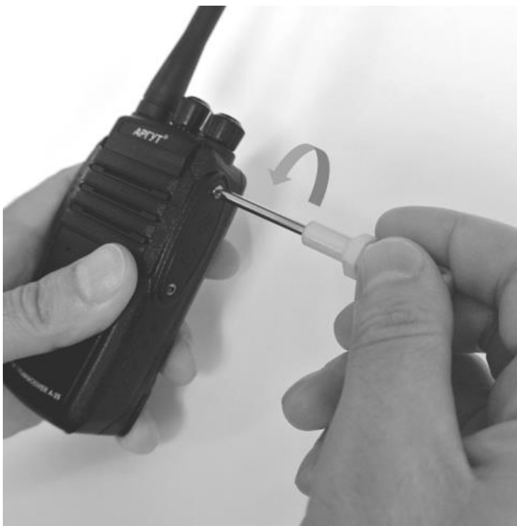
Рис. 8. Снятие защитной крышки аксессуарного соединителя.

Если вы приобрели гарнитуру и планируете её использовать, подключите её к радиостанции. Для этого выкрутите два винта на защитной крышке. Используйте крестовую отвёртку №2.